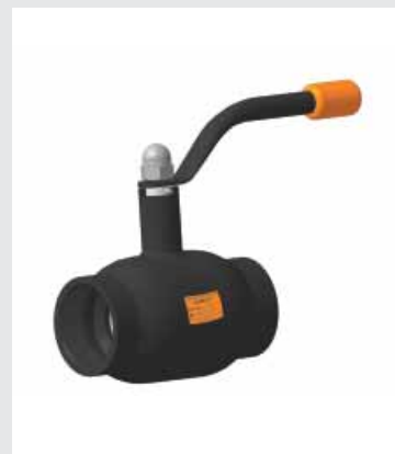
КШТ Серия 11, Ду 15-50, Ру 40 Резьба/Резьба