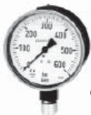
модель 432.36, безопасная перегрузка до 400 bar