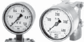
модель 732.14, безопасная перегрузка до 400 bar